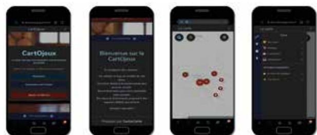
Application CartOjeux réalisée dans le cadre de l'UE d'Innovation pédagogique

Un des principaux atouts du master est la très grande palette de domaines dans lesquels travaillent ses diplômé-e-s. Les compétences du master sont recherchées par les bureaux d'étude, les start-up , les entreprises de réseaux et de services urbains et environnementaux : fibre et télécom, énergies, eau, mobilités... Les diplômé-e-s sont aussi recruté-e-s dans les cabinets de conseil, de géomarketing et les groupes d'assurance. Cette formation prépare également aux métiers de l'information géospatiale au sein des collectivités territoriales, des services de l'État (ministères et préfectures) et des acteurs de la protection civile et militaire (pompiers, gendarmerie ou défense).